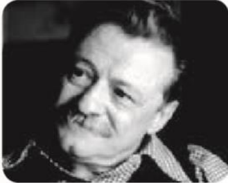
Mario Benedetti (1920 - 2009)

Escritor, poeta y dramaturgo uruguayo. Su lenguaje sencillo hizo que sus obras fueran accesibles a muchos lectores. Además, han sido traducidas a varios idiomas.