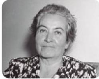
Gabriela Mistral (1889-1957)

Poetisa, diplomática y profesora chilena. Fue la primera iberoamericana en ganar el Premio Nobel de literatura, por su obra poética, en el año 1945.