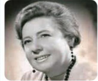
Clara Solovera (1909-1992)

Escritora, poetisa y profesora chilena. Es recordada como compositora de música folclórica o popular chilena y como autora de rondas infantiles. Su primer éxito fue la tonada "Chile lindo".