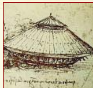
El auto acorazado de Da Vinci, según su diseño