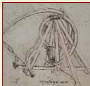
Un arma de guerra muy poderosa: la catapulta