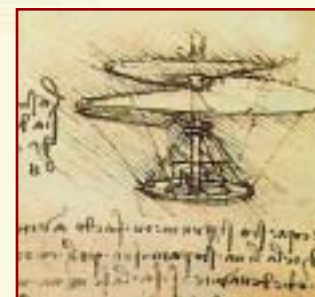
Una máquina voladora. ¿El primer helicóptero?