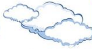
Cloud - Cloudy