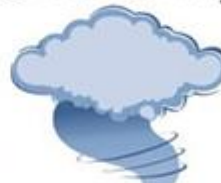
Tornado / Hurricane