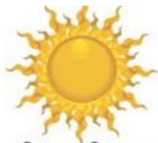
Sun - Sunny