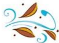
Wind - Windy