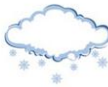
Snow - Snowy