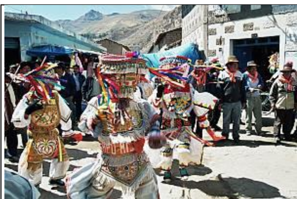
La danza de las tijeras

La danza de las tijeras se ha venido interpretado tradicionalmente por los habitantes de los pueblos y las comunidades quechuas del sur de cordillera andina central del Perú y, desde hace algún tiempo, por poblaciones de las zonas urbanas del país. Esta danza ritual, que reviste la forma de una competición, se baila durante la estación seca del año y su ejecución coincide con fases importantes del calendario agrícola.