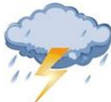
Storm - Stormy