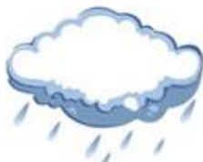
Rain - Rainy